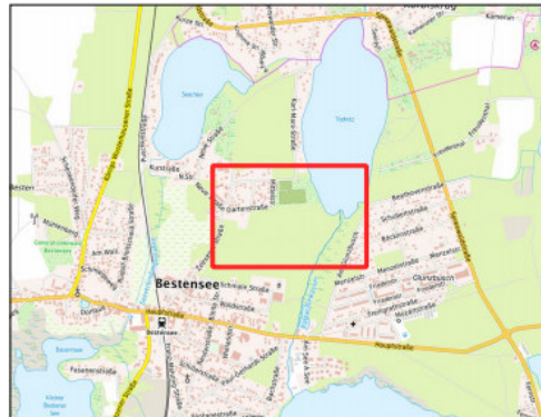
Übersichtskarte Maßstab - 1:30.000

Kartengrundlage: Flächennutzungsplan in der Fassung der 3. Änderung (2008)