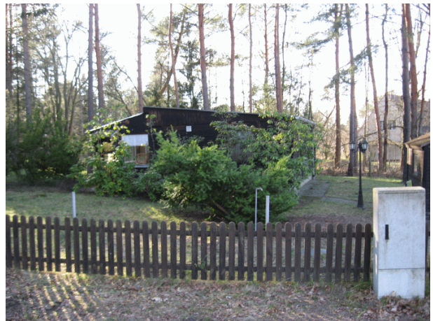
Abbildung 3: Wochenendbebauung

Im Rahmen der naturschutzfachlichen Untersuchung wurde im Plangebiet eine Bestandserfassung auf der Grundlage der „Biotoptypenkartierung Brandenburg (2011)“ durchgeführt. Das Plangebiet liegt im Siedlungsgebiet des Ortsteils Pätz und ist dementsprechend von anthropogenen Einflüssen (Bebauung, Verdichtung Ziergärten usw.) überlagert. Nur im Südosten grenzt ein Kiefernwald an das Plangebiet an. Auf detaillierte Vegetationsaufnahmen und Häufigkeitsabschätzungen einzelner Pflanzenarten wurde verzichtet, da für die Beurteilung der Eingriffsintensität in diesem Fall eine Grobeinschätzung der Biotoptypen hinreichend ist.