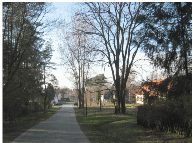
Abbildung 4: Verkehrsfläche "Neubrücker Straße"

Die Grundstücke sind mit kleinen Wochenendhäusern und Schuppen bebaut, welche von einem dichten, ca. 50-jährigen Kiefernbestand überschirmt werden. Nur auf einem Wochenendhausgrundstück im Nordosten stehen keine größeren Bäume. Ansonsten wurden die Gärten von den Eigentümern mit Rasenflächen und Ziergehölzen individuell gestaltet.