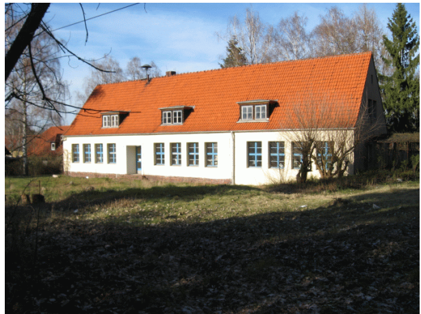
Abbildung 2: Neue Schule

Nach derzeitigem Kenntnisstand liegt der Geltungsbereich des B-Planes außerhalb von Schutzausweisungen (NSG, LSG und Natura 2000 Gebiete) sowie im Verfahren befindlicher oder geplanter Naturschutz- und/oder Landschaftsschutzgebiete.