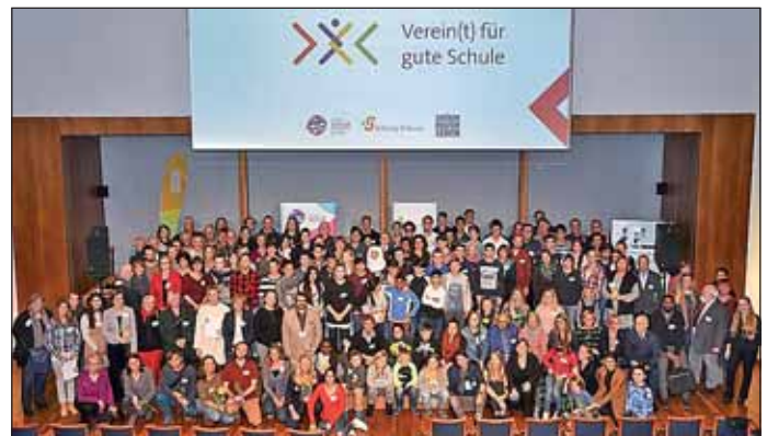
Fotograf: Peter Himself / Förderpreis Verein(t) für gute Schule

Glück“ gemeinsam mit Menschen aus dem Flüchtlingsheim Pätz und außerschulischen Künstlern Arbeitsgruppen und Workshops wie z.B. Modellbau, Kochen, Tanzen, Glücksbücher schreiben für alle Kinder der Schule angeboten.