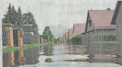
Land unter: Dauerregen, der Straßen und Häuser flutet, ist in Deutschland keine Seltenheit mehr.

Beim Schutz vor Oberflächenwasser sollten Hausbesitzer prüfen, wie Wasser auf das Grundstück gelangen könnte. Abgehal-