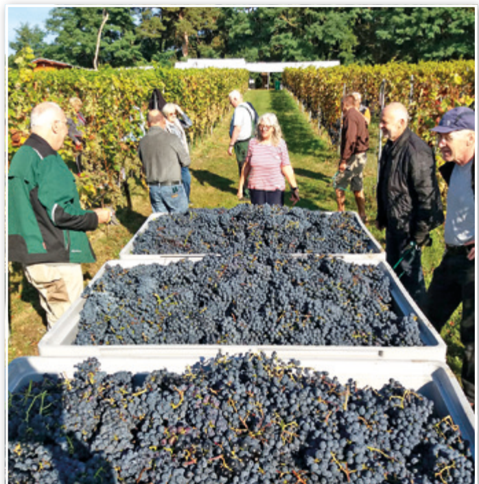
Fertig zum Transport nach Jessen