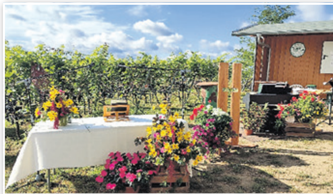
Festlich geschmückter Altar inmitten des Weinbergs

macht werden, wie stark die Verbindung der einzelnen christlichen Religionsgemeinschaften im Landkreis untereinander ist, so die Kirchenvertreter im Eins Sein. Bereits am Samstag wurde umgehend vereinbart, dass solch eine Veranstaltung zeitnah Wiederholung finden wird und die Vertiefung der Ökumene erforderlich für die Stärkung des Christentums in der Region ist. Ein herzliches Dankeschön gilt auch dem Weinberg e. V. Bestensee, der dem ökumenischen Gedanken die Möglichkeit der Entfaltung auf dem tollen Weinberg gab.