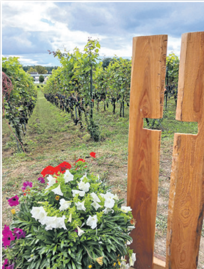
Religion im Weinberg