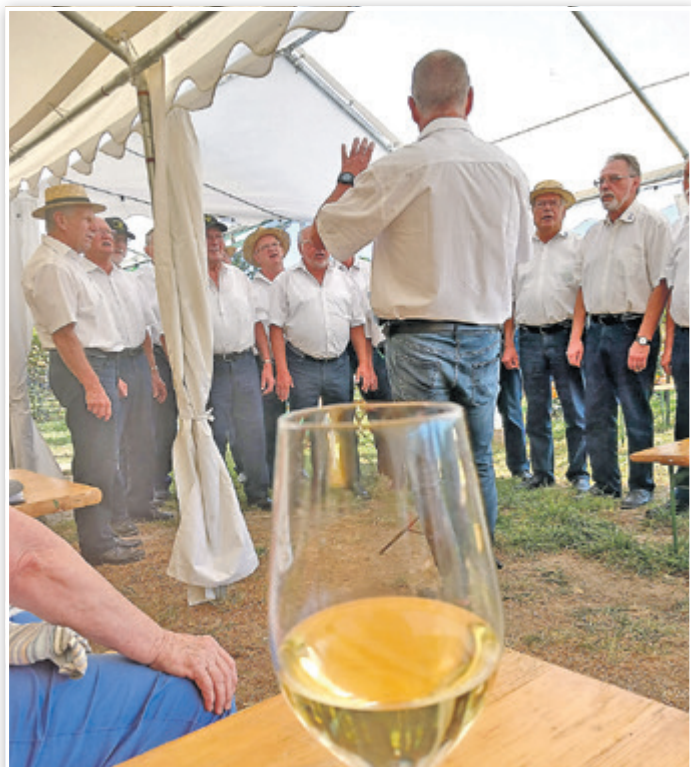
Wein und Gesang

23. und 24. September. Eine ökumenische Andacht und ein Gottesdienst der Neuapostolischen Gemeinde zwischen den Reben auf dem Bestenseer Weinberg – eine neue und sehr schöne Erfahrung für viele der Teilnehmer, aber auch den Weinbauverein. Die Beziehung zwischen Religion und der alten Kultur des Weinanbaus wurde dann auch in jeder der Predigten deutlich. Fazit aller Beteiligten: es waren stimmungsvolle, auch nachdenklich stimmende Begegnungen, die in der kommenden Weinbergsaison wiederholt werden könnten, ja sollten.