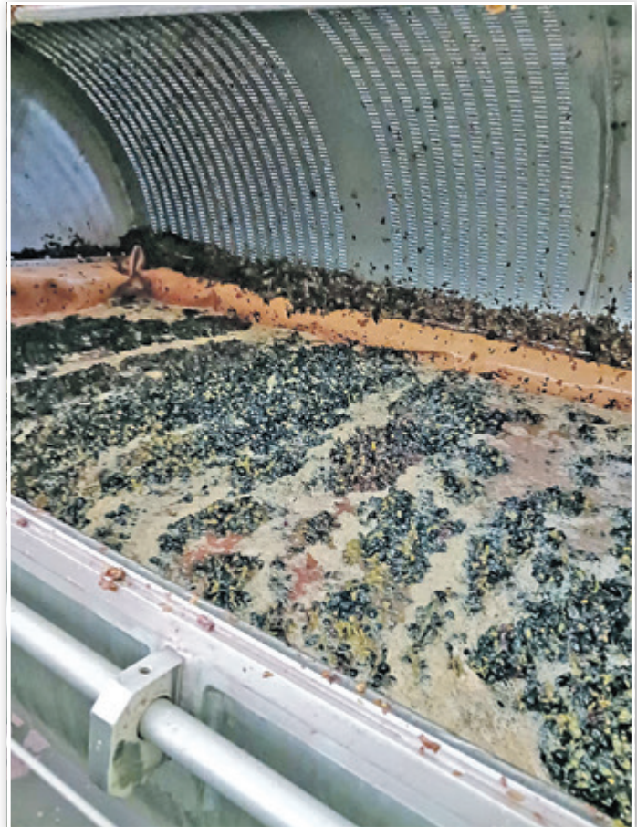
Unsere Weinbeeren in der Maische