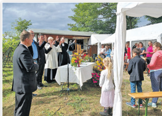
Andacht und Gottesdienst