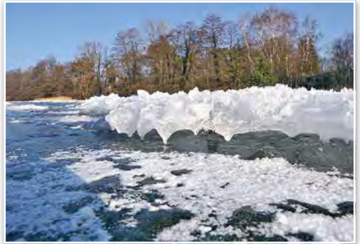
Eisbarriere auf dem Pätzer Vordersee