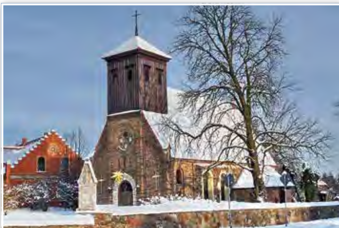
Verschneite ca. 700 Jahre alte Dorfkirche