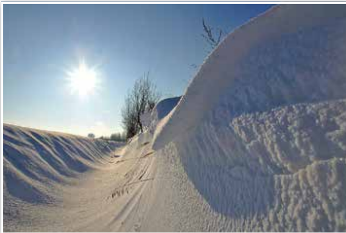
Schneewehe auf dem Pätzer Plan

Im Winter des ersten Aufzeichnungsjahres 1679 stieg die Temperatur nicht über -10 °C, am 23. Dezember 1680 morgens 6 Uhr waren es -16 °C und bis zum 7. Januar schwankten die Temperaturen um -12 °C.