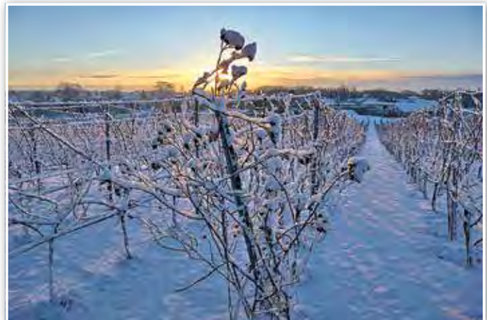
Mühlen-/Weinberg im Schnee