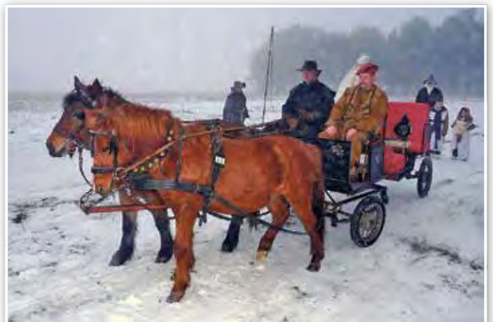
Pferdekutsche am Kieselsee