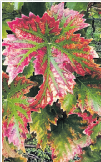
Bunt geht das Weinjahr zu Ende

tenrein ausgebaut. Menge und Qualität sind sehr vielversprechend. Selbst unser kritischer Kellermeister sparte diesmal nicht mit Lob für das Erntegut. Ungeduldig erwarten wir also die Verkostung im Februar! Zu Ostern 2023 wollen wir dann die neuen Weine erstmalig auch der Öffentlichkeit präsentieren.