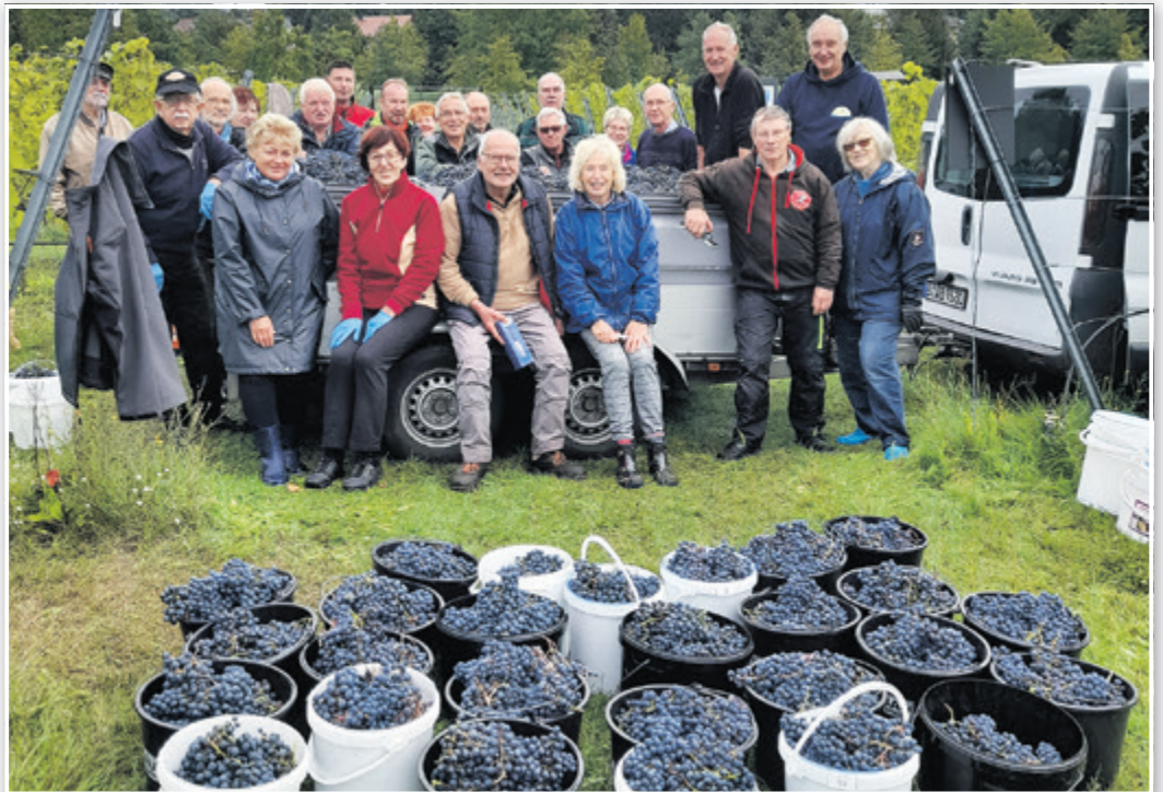
Viele Mitglieder und Helfer brachten an vier Lesetagen die Ernte ein.

Zunächst wird das, was unsere Rebstöcke produziert haben sor-