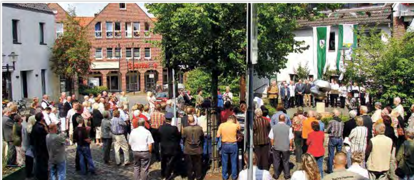
Zuschauer bei der Einweihung des Bestensee-Platzes

Am Samstag erlebte dann die 15-jährige Freundschaft Bestensee-Havixbeck einen weiteren Höhepunkt mit der Einweihung des Bestensee-Platzes in der Mitte des Ortskerns. Zahlreiche Schaulustige wohnten dem offiziellen Festakt bei.