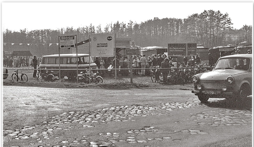
So sah 1991 unsere heutige Ampelkreuzung aus.