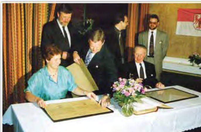
Unterzeichnung der Partnerschaft in Havixbeck 1991.

Über den Städte- und Gemeindebund fanden sich die Kommunen aus Brandenburg und NRW