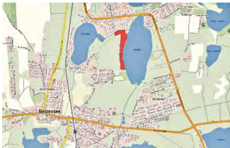
Anlage: Lage des Plangebietes der Außenbereichssatzung „Karl-Marx-Straße“