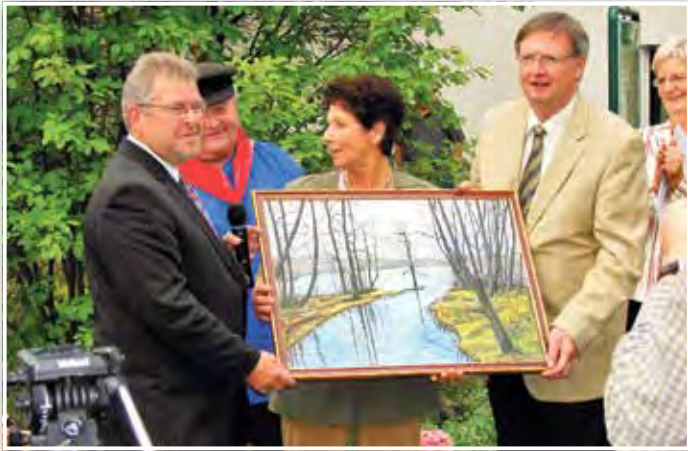
Bestenseer Gastgeschenk, gemalt von Horst Koglin

Übrigens wurde auch in unserer Gemeinde eine Straße nach unserer Partnergemeinde benannt: seit dem 3. Oktober 1997 gibt es einen „Havixbecker Ring“ im Wustrocken. Er ist nicht zu übersehen durch das Straßenschild „Havixbeck 496 km“.