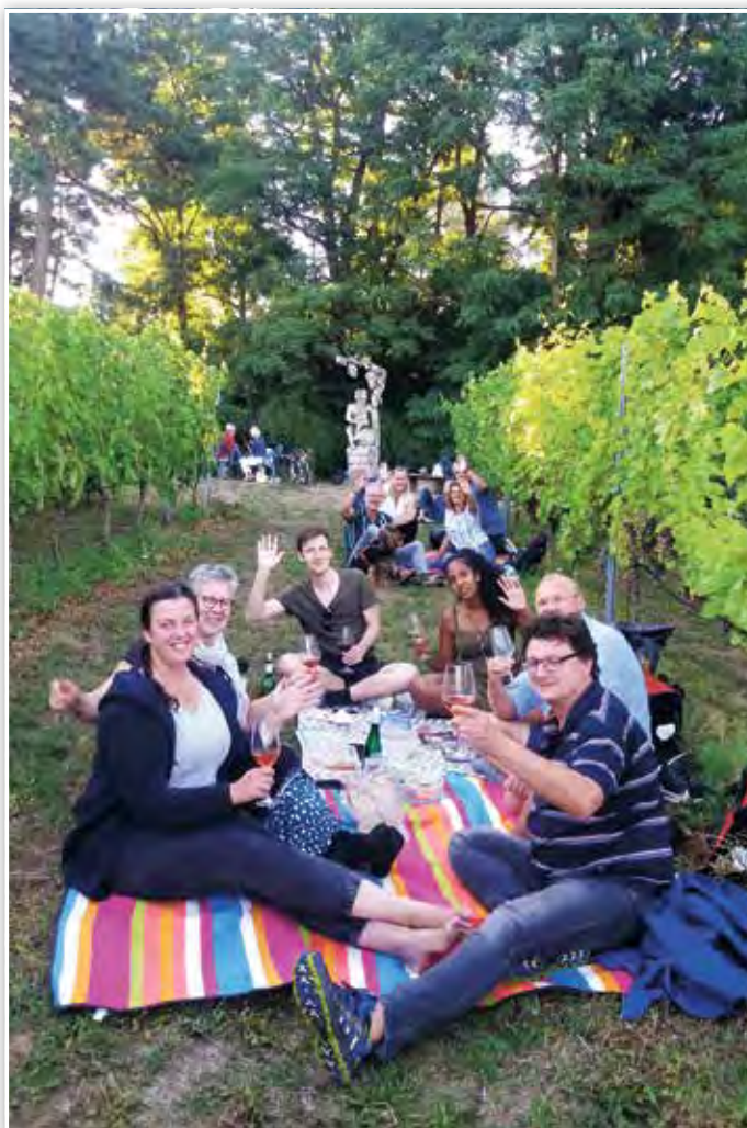
Als die Stühle nicht mehr ausreichten, machten es sich einige Gäste zwischen den Reben bequem

Eine Gruppe des Musik- und Bildungsvereins „Königshaus“ e. V.