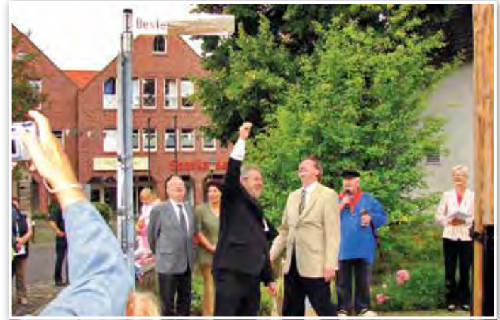
Einweihung des Bestensee-Platzes